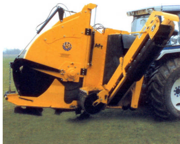
WIZZ WHEEL 75

AFT Trenchers heeft twee aftakas aangedreven aanbouw Wizz Wheels. Deze sleuvengravers voor zeer smalle sleuven hebben zich wereldwijd bewezen bij het aanleggen van drainagesystemen op golfbanen en sportvelden, dit tot tevredenheid van vooraanstaande golfclubs en sportveld bouwers.