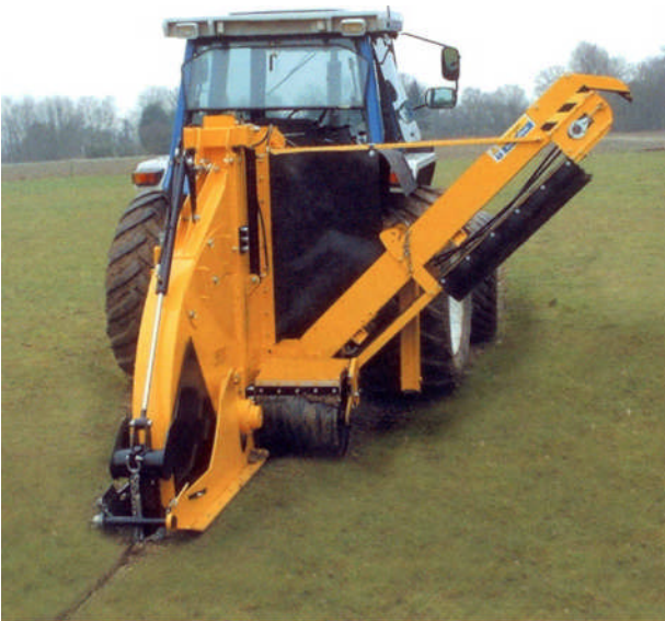
WIZZ WHEEL 75

Bij de constante vraag naar nieuwe recreatieve en professionele sportvelden hebben goede veldcondities de hoogste prioriteit. Een goed drainage systeem wordt beschouwd als de belangrijkste maatregel tot verbetering van de veldcondities.