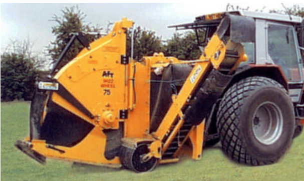
WIZZ WHEEL 75

Op grond van aanvragen naar flexibele inzetbare machines kan de AFT 75 wizz wheel zowel worden ingezet voor het graven van drainagesystemen tot een diepte van 75 cm en het graven van zand of grindsleuven vanaf 50 mm breed. De compactere AFT 55 wizz wheel wordt door vele golfclubs gebruikt om het aanwezige drainagestelsel uit te breiden met meerdere zand of grindsleuven voor het sneller afvoeren van oppervlakte water.