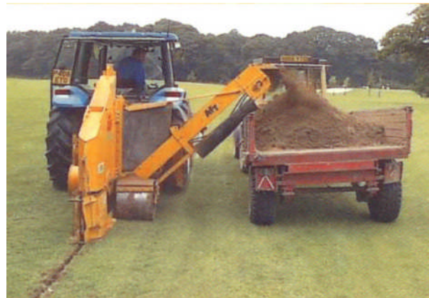
WIZZ WHEEL 55

Op grond van aanvragen naar flexibele inzetbare machines kan de AFT 75 wizz wheel zowel worden ingezet voor het graven van drainagesystemen tot een diepte van 75 cm en het graven van zand of grindsleuven vanaf 50 mm breed. De compactere AFT 55 wizz wheel wordt door vele golfclubs gebruikt om het aanwezige drainagestelsel uit te breiden met meerdere zand of grindsleuven voor het sneller afvoeren van oppervlakte water.