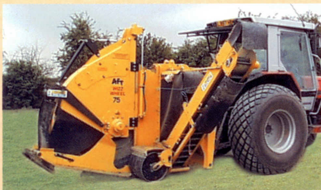
WIZZ WHEEL 75

Aufgrund wachsender Nachfrage nach flexibler einsetzbaren Maschinen kann die Fräse AFT 75 Wizz Wheel sowohl zum Fräsen für Hauptdrainagerohren mit Tiefen von bis zu 750 mm verwendet werden, als auch für Kiesbänder oder Sandschlitzte ab 50 mm Breite. Die kompaktere Fräse Wizz Wheel 55 wird von vielen Golfclubs benutzt, die bereits bestehende Hauptdrainagen um eine große Menge von Sandschlitzten bzw. Kiesbändern erweitern möchten.