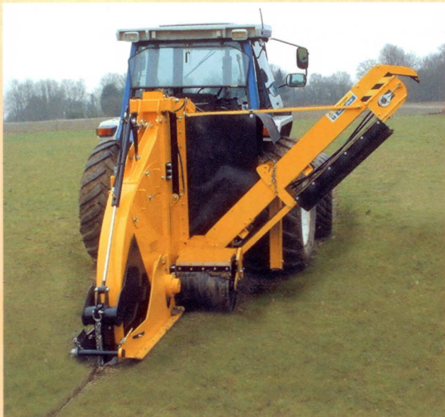
WIZZ WHEEL 75

Bei den ständig wachsenden Anforderungen an Freizeit- und Profisportanlagen haben optimale Spielfeldoberfläche oberste Priorität. Intensive Drainage gilt als wichtige Maßnahme zur Verbesserung der Rasenqualität und zur Erfüllung der heutigen Ansprüche.