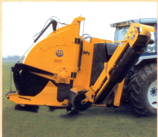
WIZZ WHEEL 75

AFT Trenchers bietet zwei leistungsstarke zapfwellenangetriebene Traktoranbaufräsen. Diese Maschinen haben sich weltweit für führende Golfclubs und Vertragsfirmen als optimale Lösung für schnelles, sauberes und kosteneffektives Installieren und Warten umfangreicher Drainageanlagen bewährt.