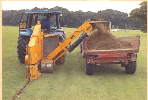
WIZZ WHEEL 55

Aufgrund wachsender Nachfrage nach flexibler einsetzbaren Maschinen kann die Fräse AFT 75 Wizz Wheel sowohl zum Fräsen für Hauptdrainagerohren mit Tiefen von bis zu 750 mm verwendet werden, als auch für Kiesbänder oder Sandschlitzte ab 50 mm Breite. Die kompaktere Fräse Wizz Wheel 55 wird von vielen Golfclubs benutzt, die bereits bestehende Hauptdrainagen um eine große Menge von Sandschlitzten bzw. Kiesbändern erweitern möchten.